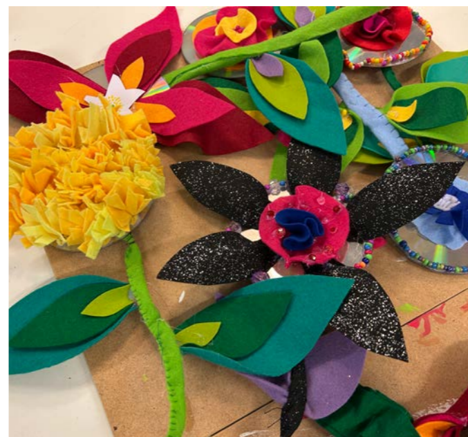
Filtblomster i alskens farver er færdigproduceret og klar til at tilføre sommerstemning på Jonstrupvang.

Det er tid til at sætte 'Musiktræets' stamme fast på væggen på Jonstrupvangs hovedgang, da CP INDBLIK kommer på besøg. Senere vil de øvrige dele følge: Blade, græs gramfonplader i trækrone, noder, lyskæder, stjernetegn og meget mere.