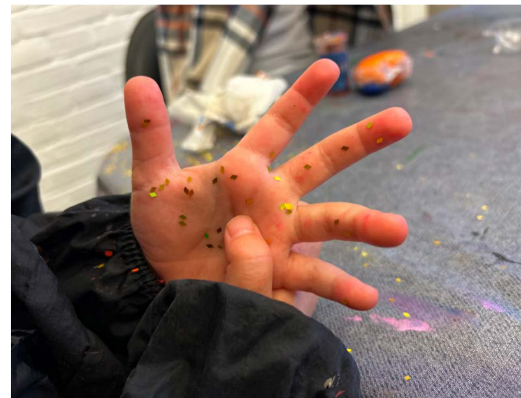
Røre, se, høre, dufte. Det har hele kroppen godt af, men det er især vigtigt for den side af kroppen, barnet har mindst kontrol over på grund af CP.

Når der ikke er glimmerkugler på programmet, puster børnene for