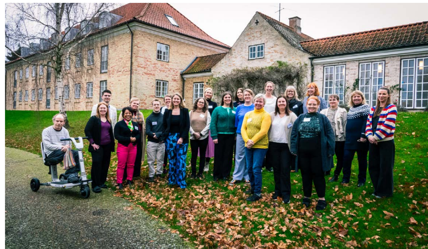
Repræsentanter ved CP Norden 2024 samlet foran Elsass Fondens bygning i Charlottenlund, hvor de på mødets anden dag blev klogere på smertelindring på Island og en undersøgelse af ensomhed, som vores finske søsterorganisation har lavet.

På den sidste dag besøgte vi Handicaporganisationernes Hus, hvor vi fra de seks lande blev klogere på, hvordan systemet ser ud i Danmark