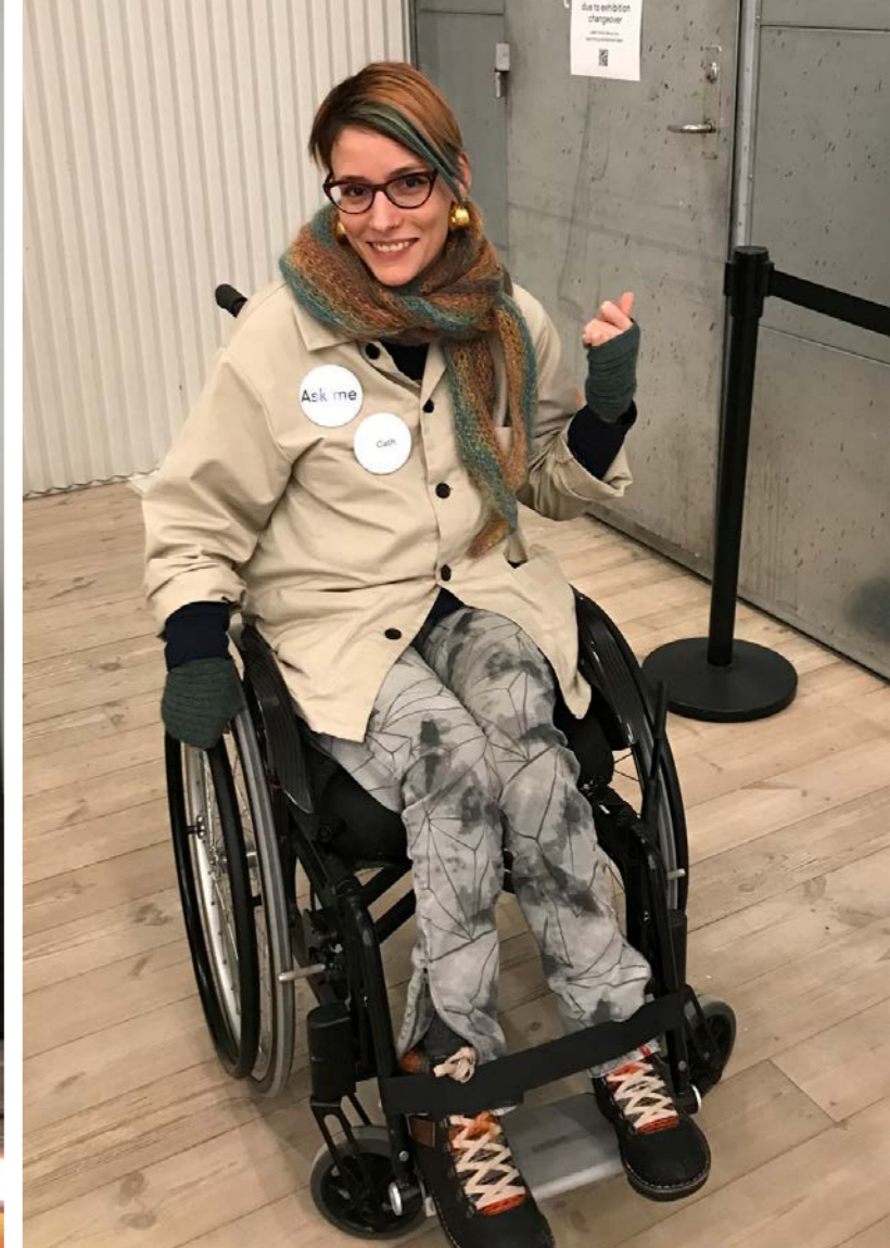
Cath på arbejde på Copenhagen Contemporary.

Min formidling af kunst bidrager ikke blot til at udvide menneskers opfattelse af den, men også deres forståelse af handicap. Adskillige gange i løbet af min arbejdsdag får museumsgæster simultan overraskelse i øjnene og smil på læberne over at møde mig flere steder i kunstcentret – som kompetent medarbejder, i kørestol. Nogle klør sig endda i håret over min imødekommenhed, førend de udbryder: